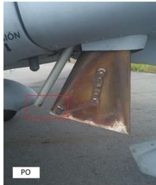
Obr. 1-1 Zobrazení problému odlomení původní konzoly L242.6674-00.17C